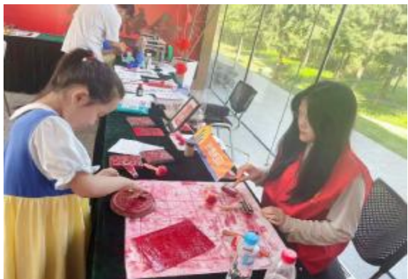
“水滴·湖光”党群服务中心活动现场