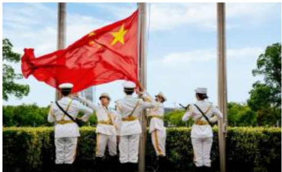
学校举行升国旗仪式

全会强调,踏上新征程,教育的基础性、先导性、全局性地位和作用更加突显,学校要牢牢把握新时代高等教育发展使命任务,积极抢抓海洋强国、航运强国、上海国际航运中心建设等一系列重大发展机遇,把推动高质量发展作为办学治校首要任务,一体推进教育、科技、人才融合发展。要紧跟学科前沿完善布局,集中力量开展关键核心技术攻关,加快实现重大创新突破。要加强专业设置动态调整,大力培养行业急需紧缺人才,大幅提升人才培养质量,增强服务国家和区域重大战略需求的支撑力、贡献力。