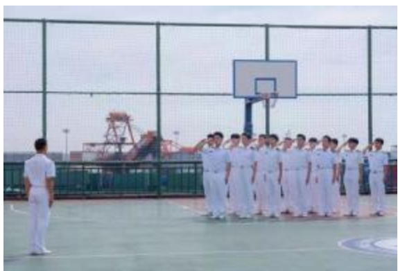
师生进行队列训练

海大师生通过国庆升旗仪式和文化体验、志愿服务、体育锻炼等特色活动,向国旗敬礼致敬,用歌声唱出对祖国的深深祝福。参与活动的师生们表示,“祖国是我们自信的源头,赋予我们无穷的力量。愿伟大祖国繁荣昌盛,我们将勠力同心,破浪前行,为建设海洋强国、航运强国积蓄力量,为建设具有全球影响力的高水平海事大学作出贡献!”