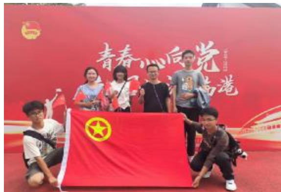
“体悟年轻的城”活动现场