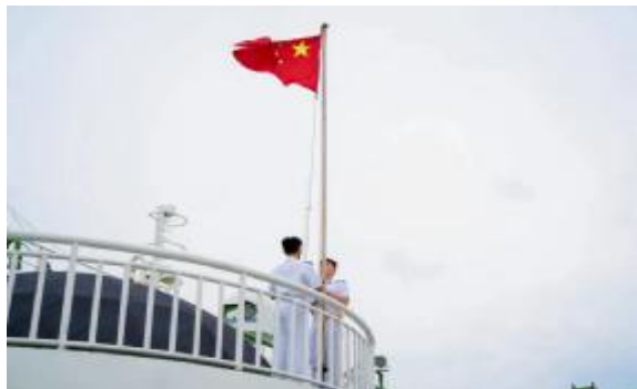
“育明”轮举行升国旗仪式