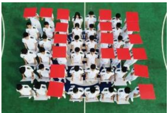
学生用图板拼出“74”字样

为庆祝中华人民共和国成立74周年,10月1日上午,海大师生在校园、校船等处举行国庆升旗仪式并开展相关活动。