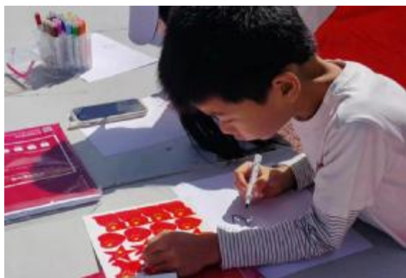
“手绘爱国情”活动现场